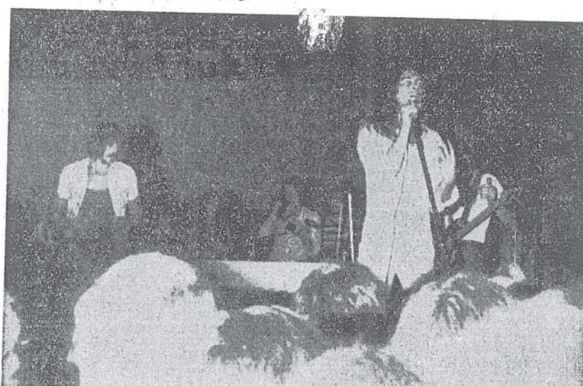
Die Hauptattraktion des Festivals war die Deep Purple. Sie dürfte die derzeit erfolgreichste Band der Welt sein. Ihre etwa 90 Minuten lange Show war mitreißend.